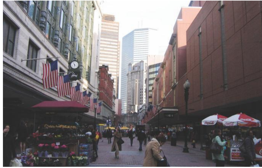
En el Corazón del centro de Boston.