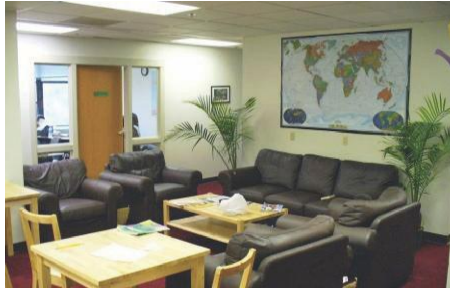
Sala de estudiantes para estudiar y relajarse.