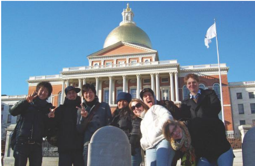
Lugares Históricos y culturales al lado de la escuela.