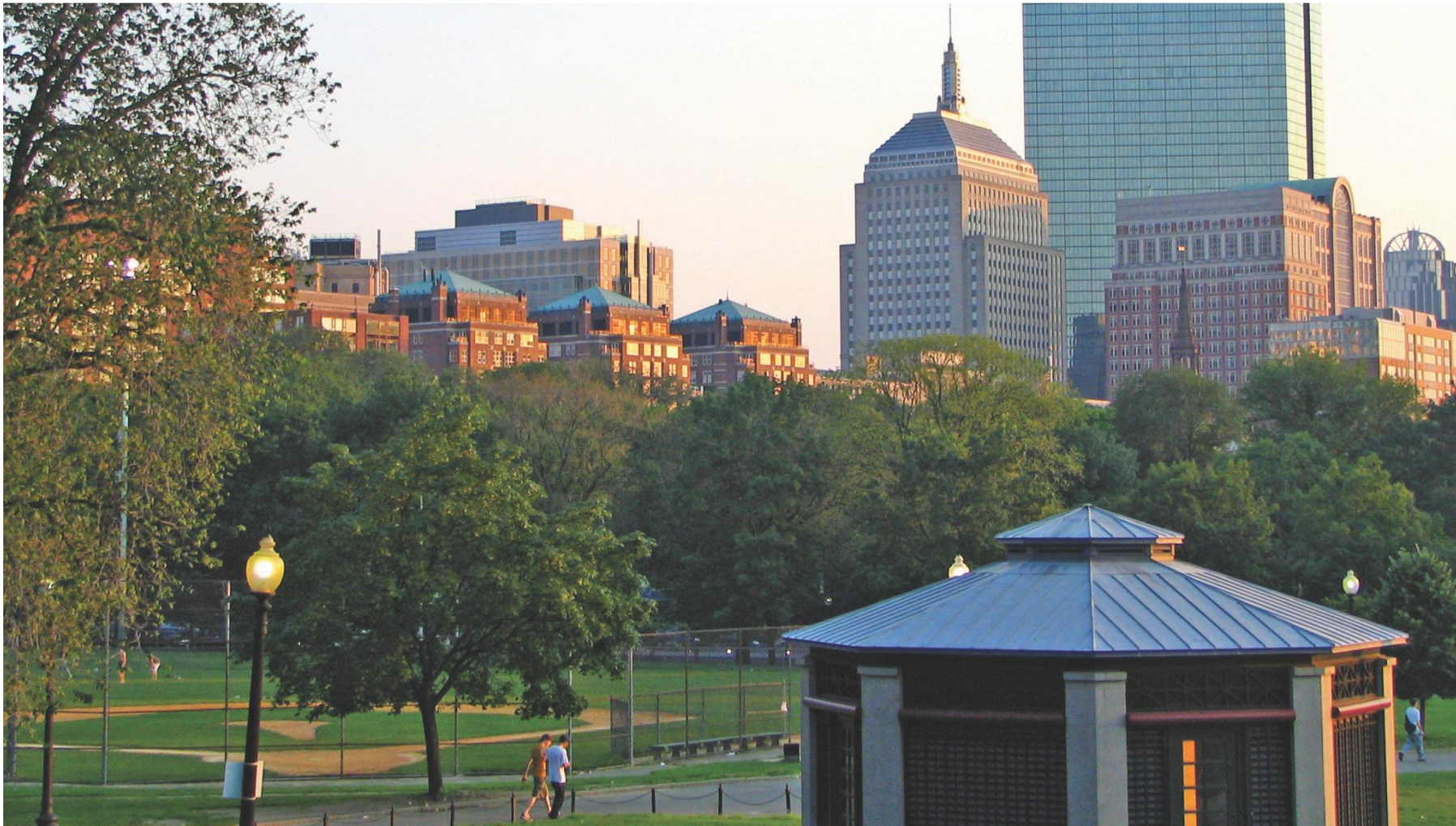
The Boston Common

El centro de Boston está situado en el Corazón de la ciudad con vista a su área metropolitana, al famoso parque público y a sus jardines. Las instalaciones recientemente renovadas ofrecen a los estudiantes un ambiente agradable de aprendizaje en la ciudad de destino principal en los Estados Unidos para estudiantes internacionales. A pocos pasos del centro, los estudiantes pueden ver en la calle músicos tocando en Faneuil Hall, también podrán disfrutar de un espectáculo gratuito de Shakespeare en el parque o una muestra local de pescados y mariscos en un bar de Ostras de 200 años de edad!