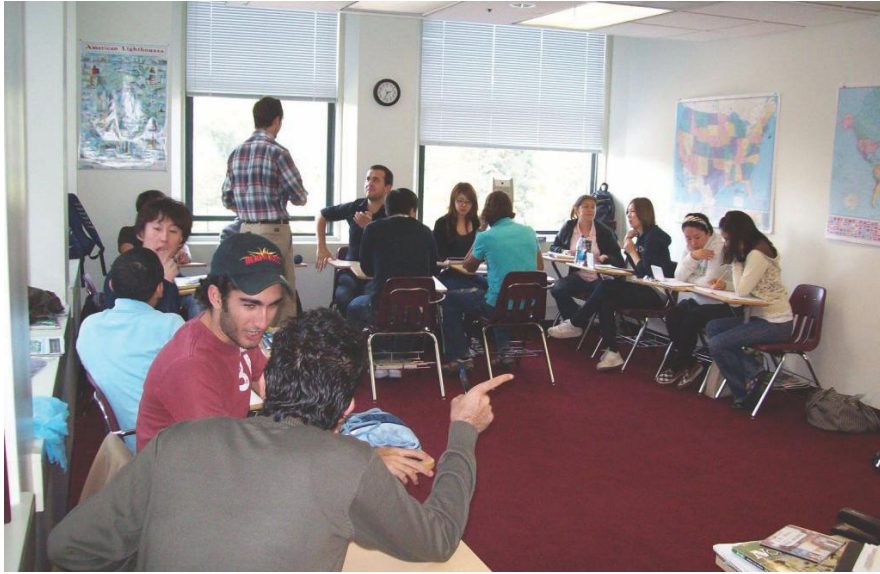
Aulas modernas para satisfacer las necesidades de los estudiantes.