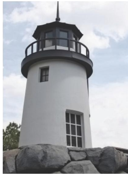
Un corto viaje al Faro.