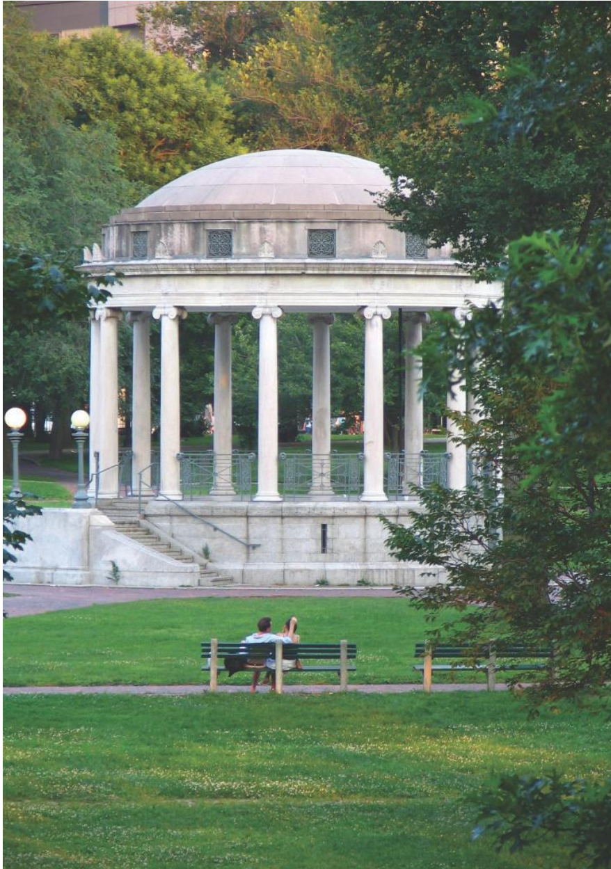
Boston ofrece espacios para relajarse y jugar.