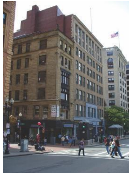
Nuestro centro en Boston