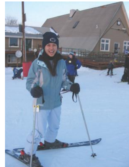
Experimenta la diversión del invierno.